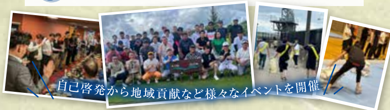
自己啓発から地域貢献など様々なイベントを開催